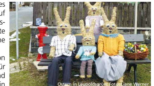
Ostern in Leupoldsgrün