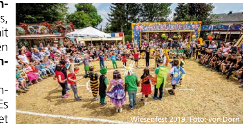
Wiesenfest 2019