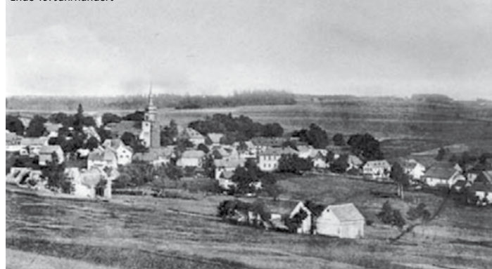
Ende 19. Jahrhundert