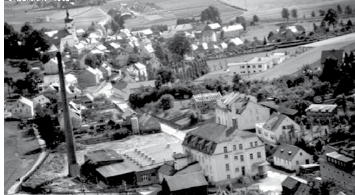
Ortsansicht - 1962